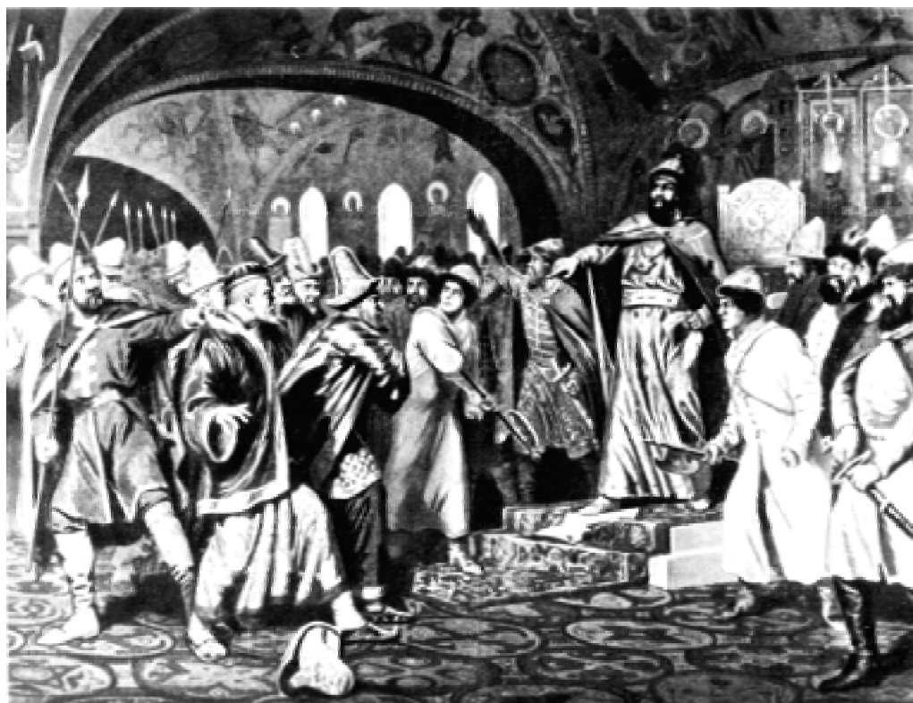
Иван III разрывает ханскую грамоту с требованием дани. С картины А. Д. Кившенко, 1879 год

татарским данником; его власть оспаривалась удельными князьями; Новгород, стоявший во главе русских республик, господствовал на Севере России; Польско-Литовское государство стремилось к завоеванию Московии; наконец, ливонские рыцари еще не сложили оружия. К концу царствования мы видим Ивана сидящим на вполне независимом троне об руку с дочерью последнего византийского императора. Мы видим, как остатки Золотой Орды толпятся у его двора. Новгород и другие республики покорны. Литва уменьшилась в своих пределах, и ее король является послушным орудием в руках Ивана. Ливонские рыцари разбиты. Изумленная Европа, в начале царствования Ивана даже не подозревавшая о Московии, затиснутой между Литвой и татарами, была ошеломлена внезапным появлением огромной империи на ее восточных границах, и сам султан Баязет, перед которым она трепетала, услышал впервые от москвитов надменные речи”.