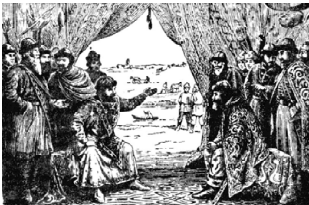
Владимир Мономах на совете князей

В XI веке талантливый русский полководец и государственный деятель Владимир Мономах для борьбы с полчищами кочевников – половцев сумел привлечь к походам на врага не только княжеские дружины, но и широкие слои населения – ополчения из крестьян и горожан.