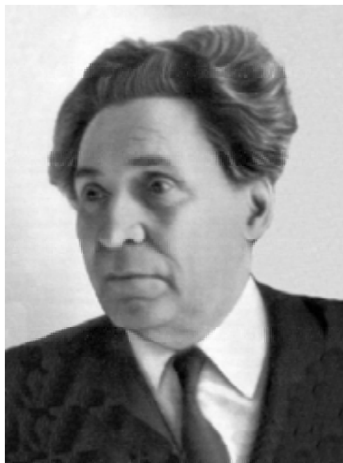
Алексей Кузьмич Югов.

Неоценимый вклад в духовную и историческую культуру России внес наш славный земляк из села Каминки Куртамышского района, исследователь древности, историк и писатель, лауреат Государственной премии Алексей Кузьмич Югов, сделавший перевод памятника древнерусской культуры “Слова о Полку Игореве”, ряда летописей и создавший на их основе историческую эпопею “Ратоборцы”. Труды этого замечательного человека вернули памяти россиян многие страницы из славной истории своих предков. Многие книги Алексея Югова хранятся в Каширинском литературно-краеведческом музее.