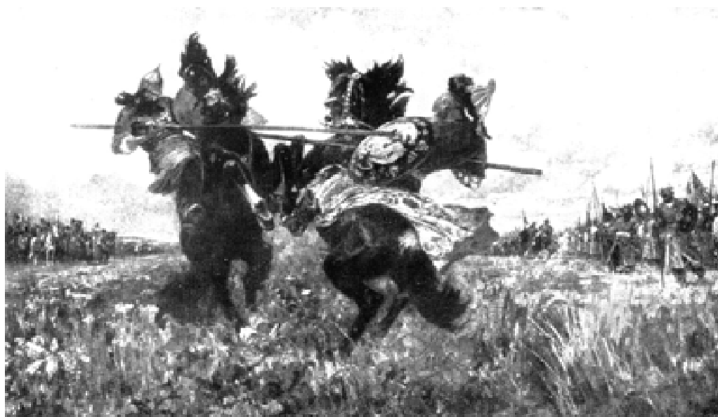
Поединок Пересвета с Челубеем. С картины М.И. Авилова

Покрепче перехватив свое оружие, ринулся ему навстречу Пересвет.