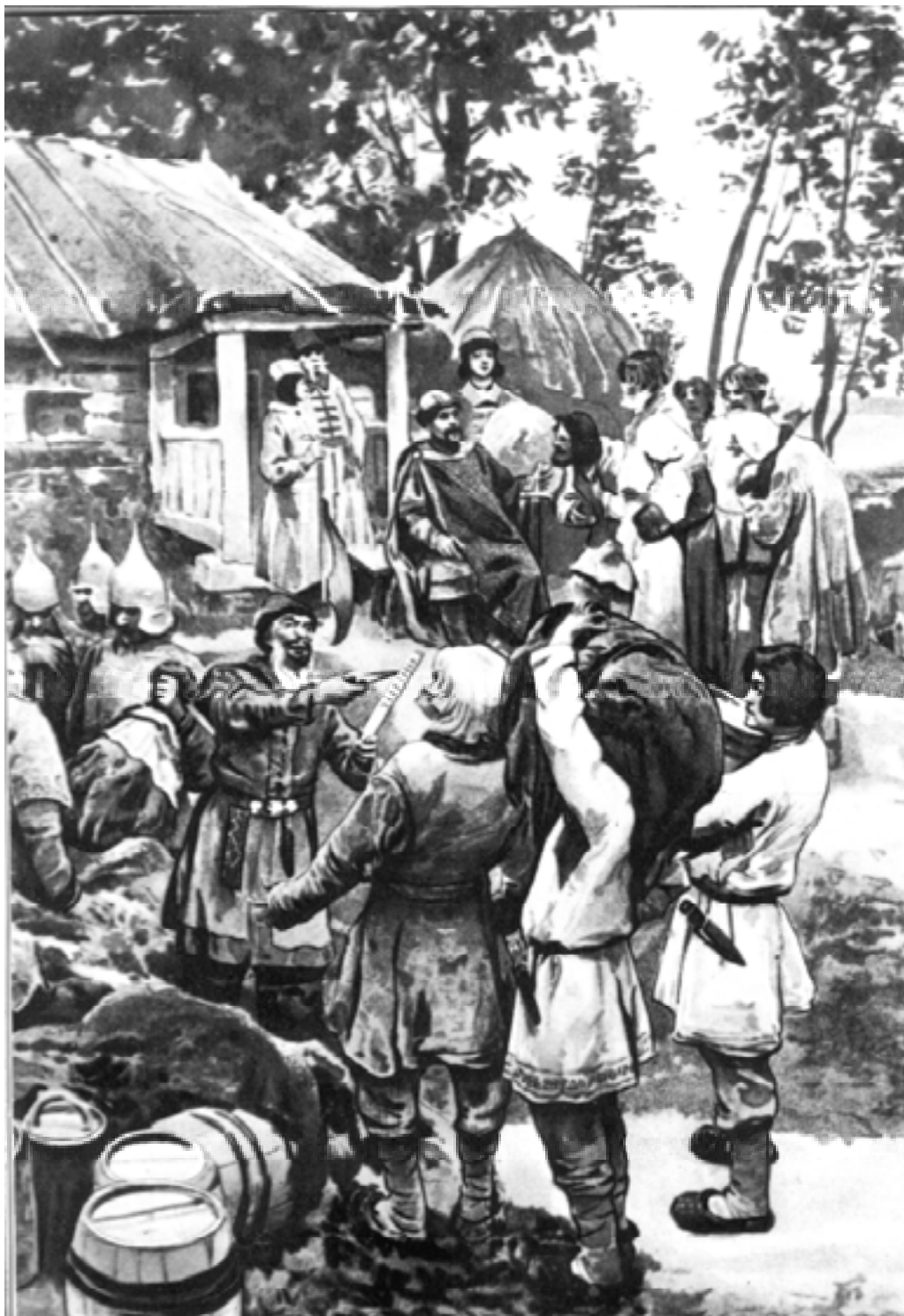
Полюдье. С картины К.В. Лебедева.