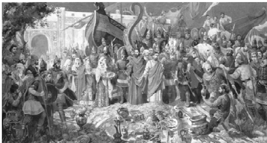
Византийские послы откупаются драгоценностями от русской дружины

В 907 году князь Олег вновь взял Константинополь, в знак победы прибил свой щит на его воротах, получил богатую дань и подписал выгоднейший договор о торговле: товары россос беспрепятственно перевозились в Азию и Европу, не облагались пошлинами, русские купцы могли до полугода жить в Константинополе и обеспечиваться провиантом за счет казны города и так далее... “Такого унижительного договора великая Византийская империя не знала никогда”, - отмечают многие европейские летописи тех лет.