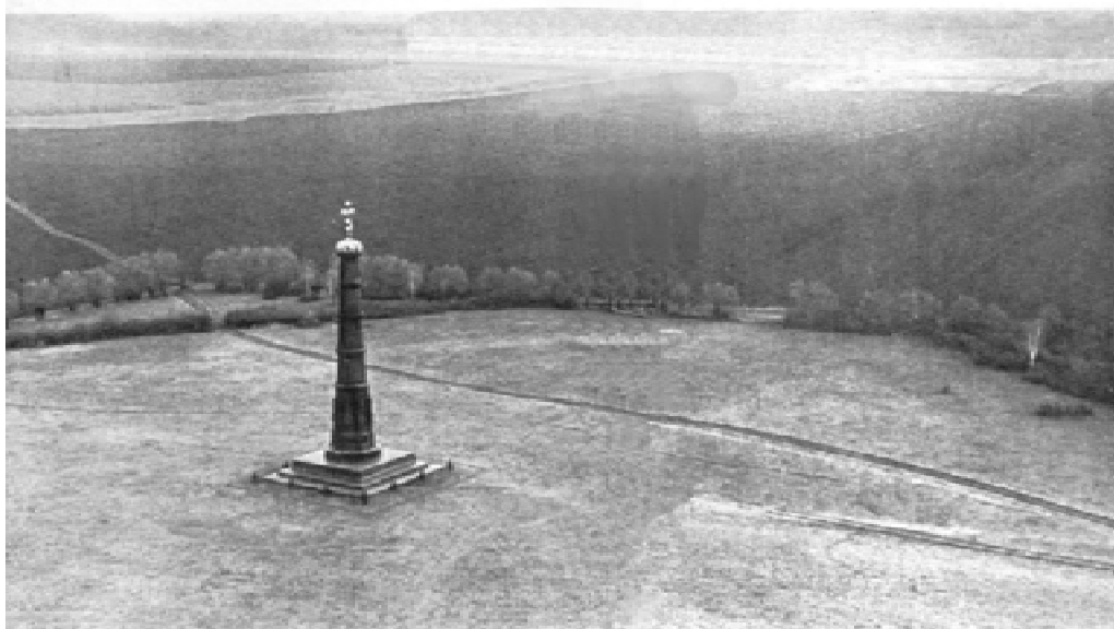
Памятный обелиск на Куликовом поле. Архитектор А. П. Брюллов

Давно, отжив свой век, упали и истлели дубы Зеленой Дубравы, но уже шесть веков живет в сердце народа нетленная память о героях, ставивших сволбу долины выше жизни.