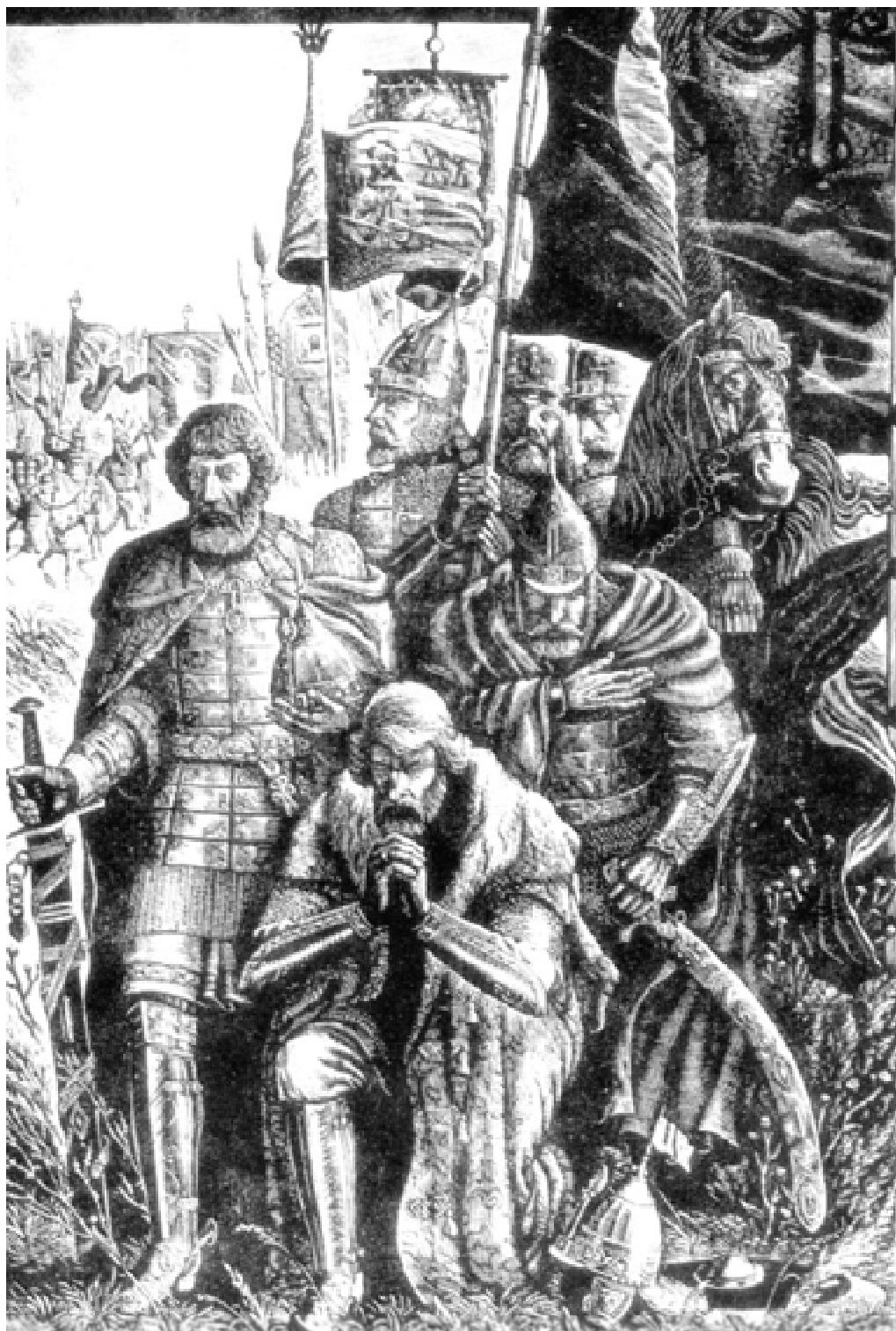
Перед битвой. С гравюры С.М. Харламова.