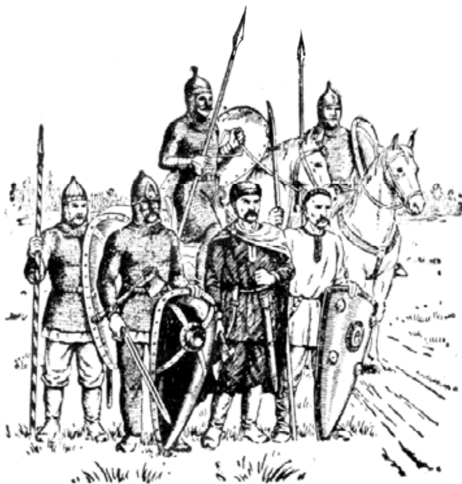
Воины древнерусского государства

“держал совет” обо всех делах – о войне и мире, походах и посольствах, размерах дани и раздачах военной добычи, земель, казнях и помилованиях. Вместе с дружинниками он составлял грамоты-указы, вершил суд по “закону русскому”.