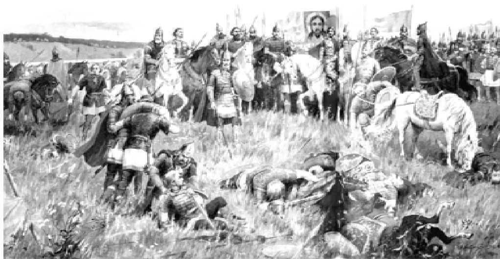
Русское войско после битвы на поле Куликовом

Дмитрий пришел в себя и спросил: “Скажите мне, как теперь?”