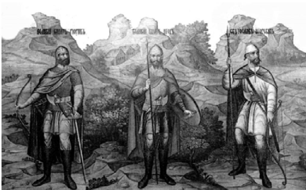
Первые князья дома Рюриковичей: Рюрик, Олег и Игорь. Палехская роспись Грановитой палаты в Кремле. XIX в.