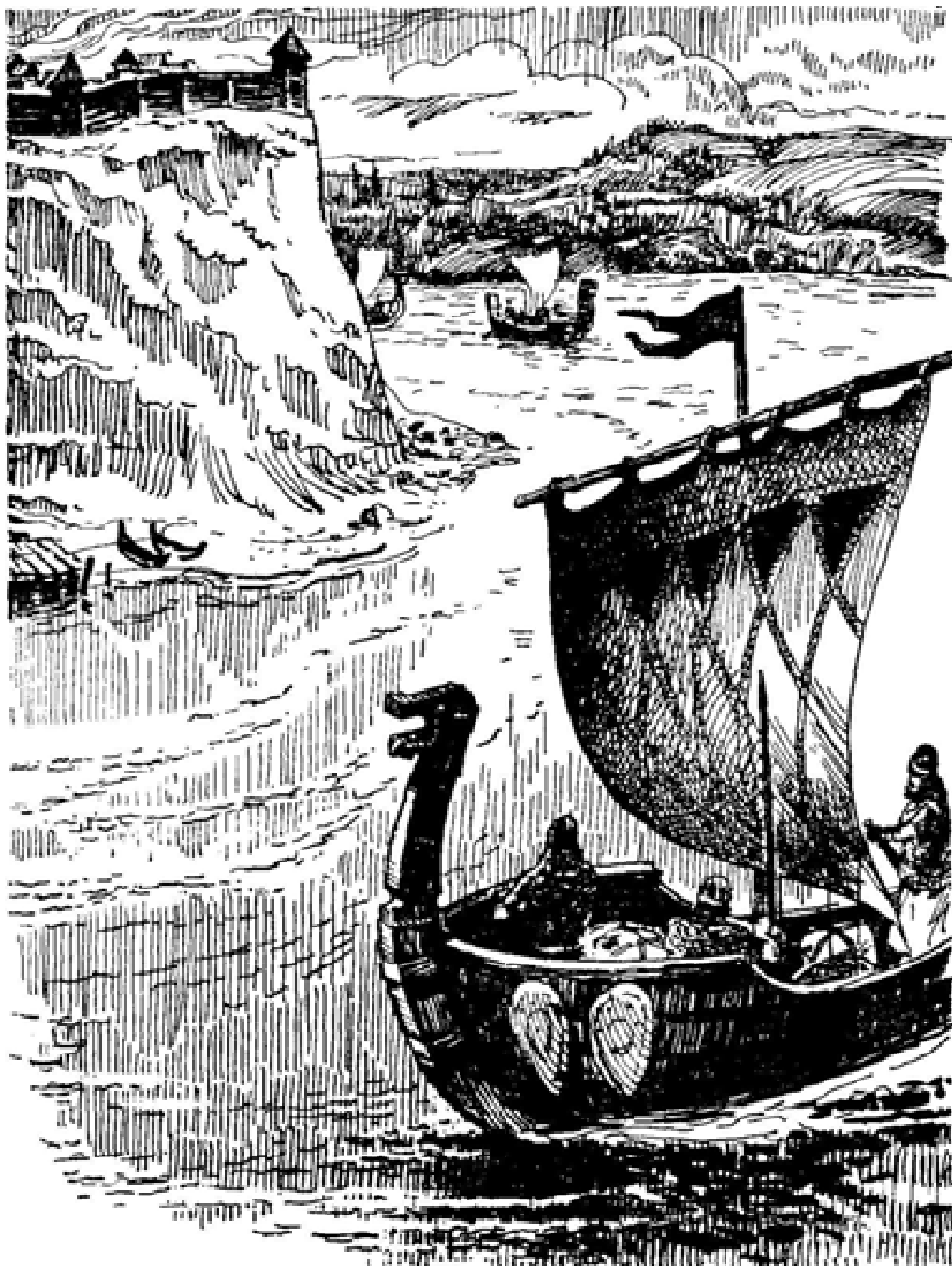
Русские воины в походе

“Где теперь царь христолюбивый? Где воинство? Где оружие, машины, военные советы и припасы? — трагически вопрошал в обращенной к горожанам проповеди константинопольский патриарх Фотий. — Что за удар и гнев столь тяжелый и поразительный? Откуда нашла на нас эта